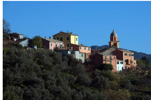
Salto della lepre : un balcone a picco sul mare - Le scogliere di origine vulcanica di Framura - L'incantevole borgo di Montaretto immerso tra ulivi e vigneti

Il luogo: compreso nell'area dell'ex parco dei promontori di Levante il sentiero azzurro percorre un'area di grande interesse paesaggistico per la presenza di numerosi affioramenti di rocce vulcaniche che determinano suggestivi cromatismi in contrasto con le acque azzurre del mare.