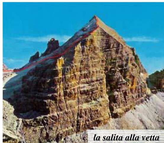
la salita alla vetta

Dai resti dell'ex Rifugio Cantore l'escursione diventa più semplice: continuiamo infatti ad aggirare la Tofana di Rozes sul versante est e sud, camminando ora quasi in piano fino a raggiungere nuovamente la Forcella Col dei Bòs non prima di esserci soffermati ad osservare gli ingressi di opere di ingegneria bellica quali la Grotta di Tofana e la Galleria del Castelletto. Completato così il "giro" della Tofana, risaliamo in una sinfonia di colori attraverso l'omonima forcella fino al Rifugio Lagazuoi (2.752 m). Dopo una sosta per ammirare il notevole panorama che si gode dalla terrazza del Rifugio, lasciamo il Monte Lagazuoi per scendere verso il Passo di Valparola, dove dopo aver recuperato le auto termina la nostra favolosa escursione.